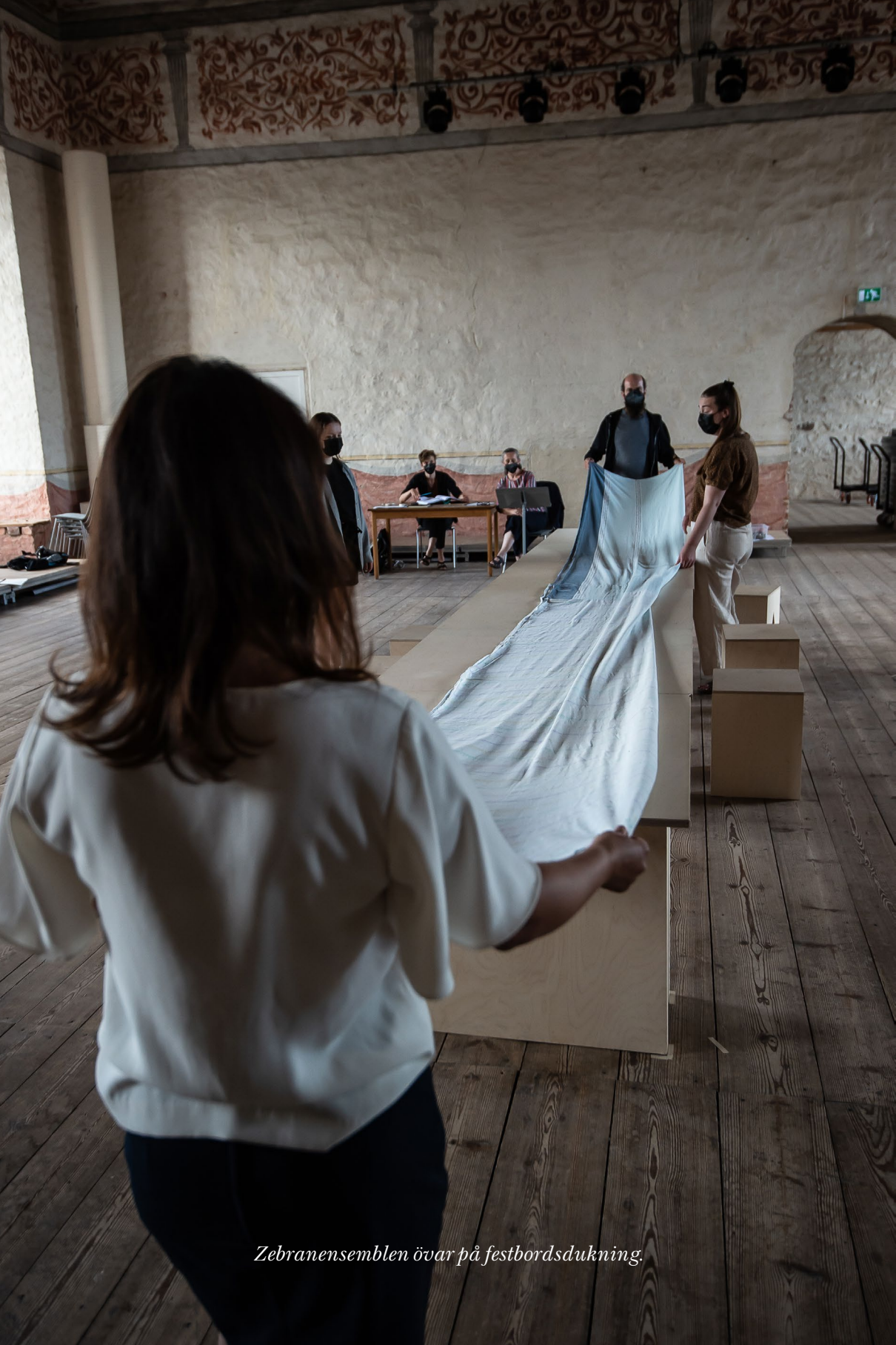
Zebranensemblen övar på festbordsdukning.