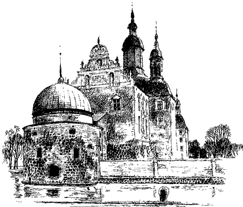
Teckning: Lars Guth.

"Vad det språk stenar tala verkar likt långa stråkdirag ur en djup violoncell! Det är vid ett stort byggnadsverk, som rymden fylldes av den atmosfär, som skapat tonerna, och vari konstnären levde, av det liv som en gång pulserat och med hammarlag på hammarlag trängt in i stenen, och blivit kvar där."